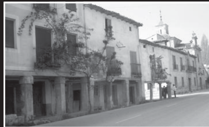
Soportales de Tendilla

De la carretera, a los pies de las ruinas mencionadas, asciende una senda, que va por el borde de la Alcarria pero en su parte más alta, por la que seguiremos, siempre al mismo nivel, pero al borde de la meseta. A los 3 km. desde la Salceda, llegaremos a un monte sobre Tendilla: el Guijarral; la bajada puede hacerse siguiendo la senda, que desciende por un espolón, en dirección O., o por el camino de los arrieros, a la izquierda de esta senda. Este descenso es lo mejor de esta ruta, atraviesa un pinar, y tiene impresionantes vistas del valle.