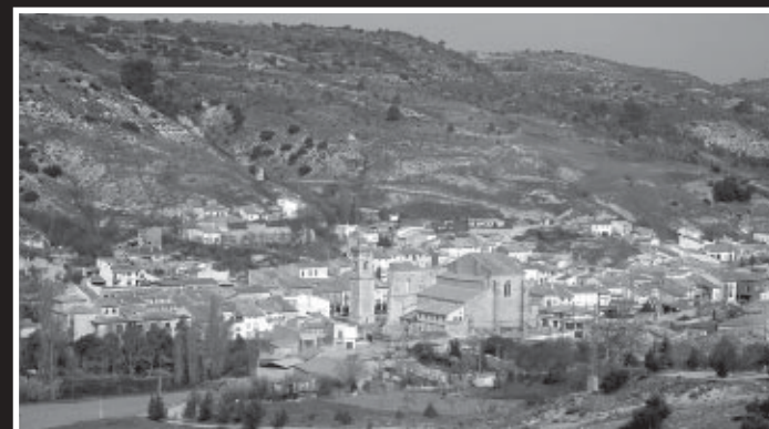
Panorámica de Tendilla