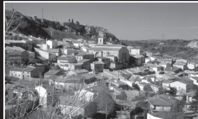
Vista de Peñalver