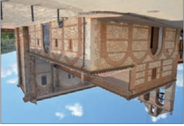
Iglesia de Malaga del Fresno

A la izquierda se queda el lavadero recientemente reconstruido y a su lado una columna rematada con sencilla cruz de hierro a modo de calvario. Poco entrada está abierta para