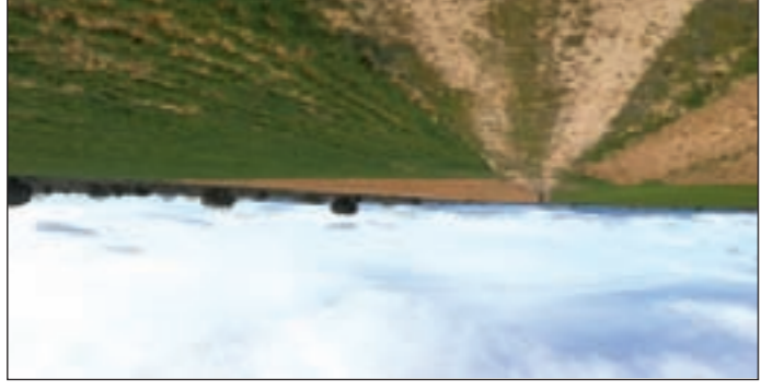
Por la Cañada Real