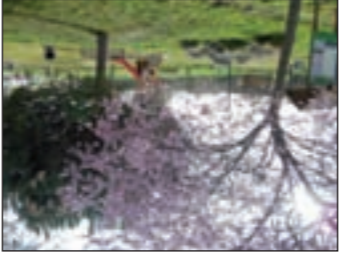
Parque de las Dueñas

Iniciamos la ruta de senderismo, al igual que las tres de BTT, junto al panel situado en el Parque de las Dueñas. Nuestra ruta comienza en la dirección que indica la flecha direccional tomando dirección noreste. A poco de salir atravesamos el arroyo de las Dueñas por un puente peatonal.