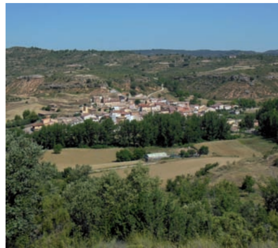
Vista de Henche