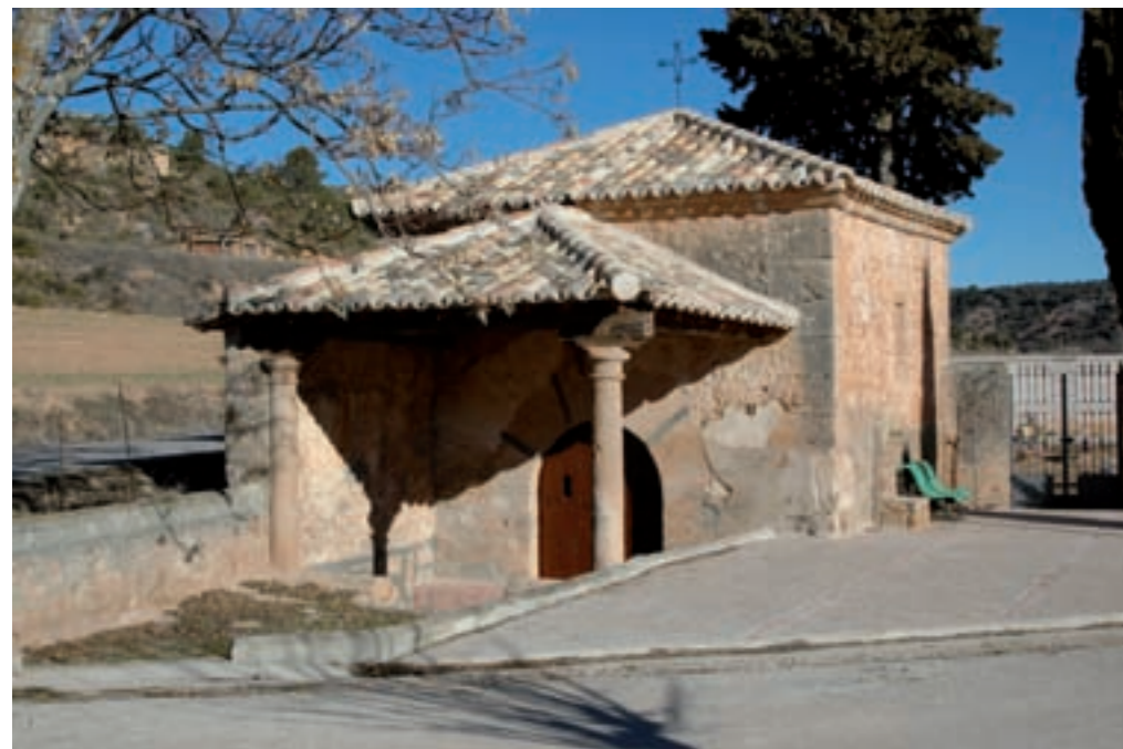
Ermita de San Roque