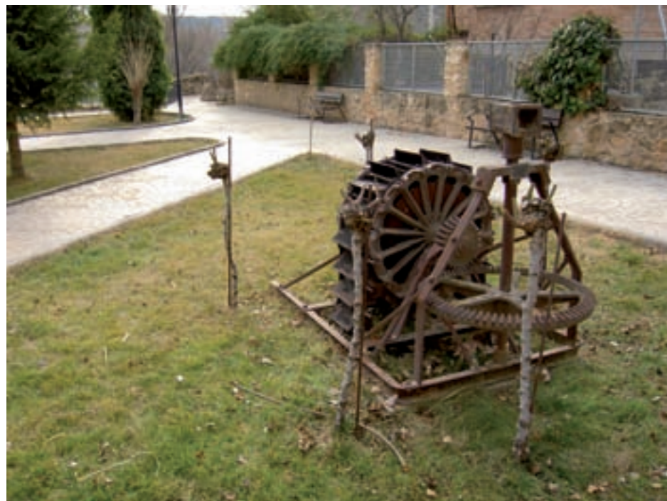
Parque del Pradillo