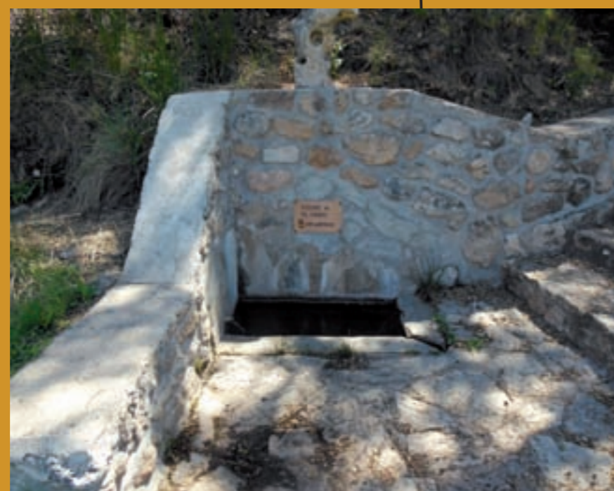
Fuente del Santo