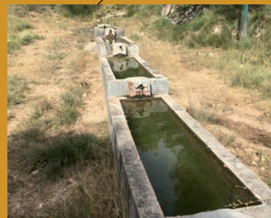
Fuente de las Mariquillas