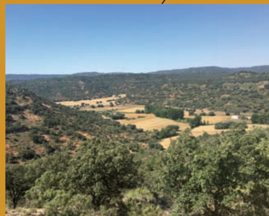
La vega desde Valdecente