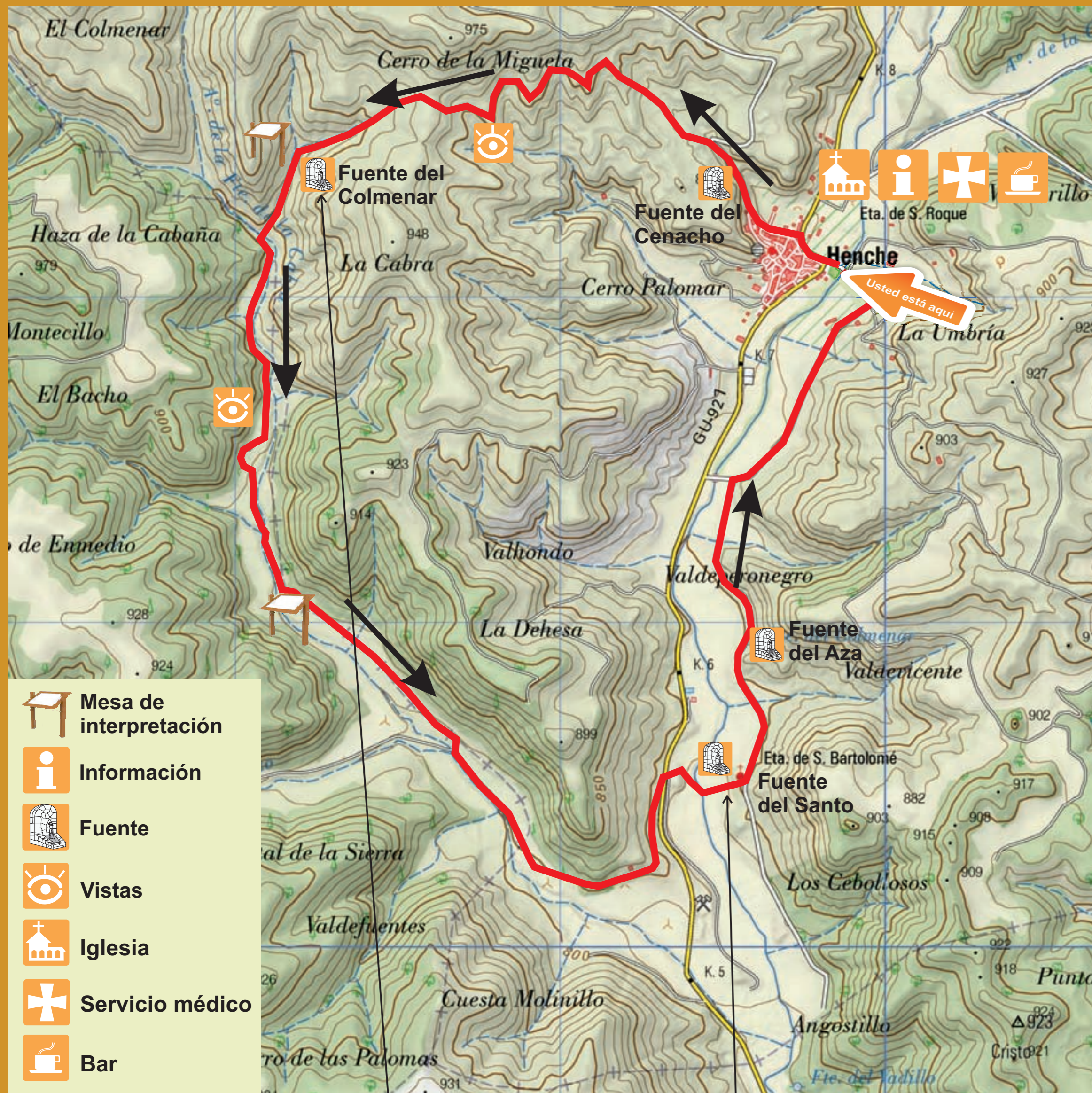
La Fuente del Colmenar