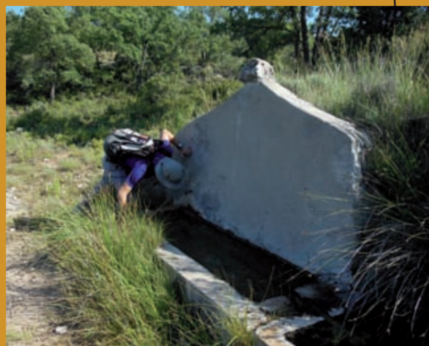
Fuente del Colmenar