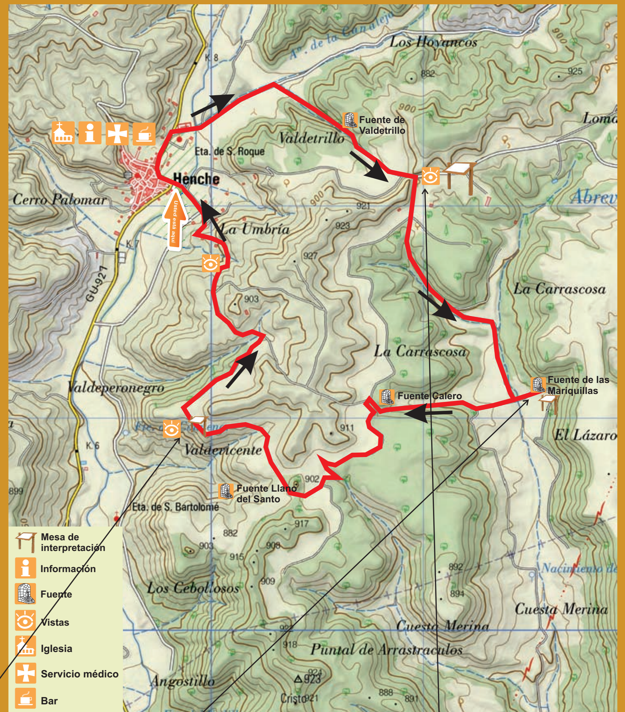
El Camino de las Tainas