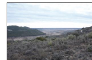
Paisaje de la vega de Horche

Continuaremos nuestro camino para descender por un caminito que nos saca de nuevo a la carretera; seguimos por ella a la derecha. Recomendamos caminar por