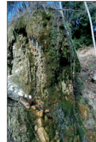
Pequeña cascada en La Fuensanta

Este camino en fuerte descenso nos saca a la antigua carretera y frente a nosotros hay un pequeño aparcamiento y junto a él unas escaleras de cemento que descienden al área recreativa de La Fuensanta, con mesas y asientos. Es un buen lugar de descanso. En uno de los rincones de este paraje hay una cascada tobácea que merece la pena descubrir, y que se surte de un manantial que viene de más arriba.