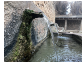
Fuente de la Pililla

Esta es una ruta sencilla y corta que la podemos hacer en familia con los pequeños de la casa, ya que apenas reviste dificultad.