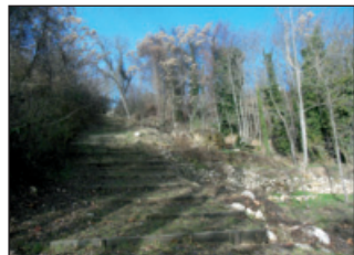
Junto a La Fuensanta

la izquierda y con el chaleco puesto. Apenas tiene tráfico pero recomendamos extremar las precauciones, máxime si se va con niños.