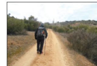
Por el Camino de la Pililla

Seguimos por un camino en dirección contraria al que hemos traído y que se encuentra a la derecha. Poco después encontramos un camino que desciende rápidamente y que nos sale a la izquierda, continuamos por él.