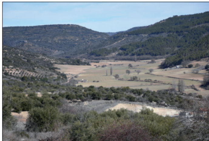
Valle del Ungria

Una vez en el pueblo podemos visitar sus callejuelas, la iglesia parroquial, asomarnos a los miradores o conocer la afamada Ruta de las Bodegas de Horche.