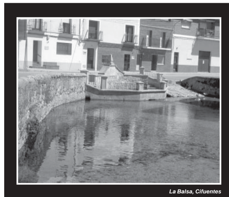
La Balsa, Cifuentes

Las fiestas Patronales del Santísimo Cristo son durante la 1ª quincena de septiembre y las Ferias de San Simón a finales de octubre.