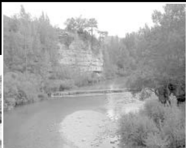
Algunos de los parajes que contemplará el viajero a lo largo de la ruta.