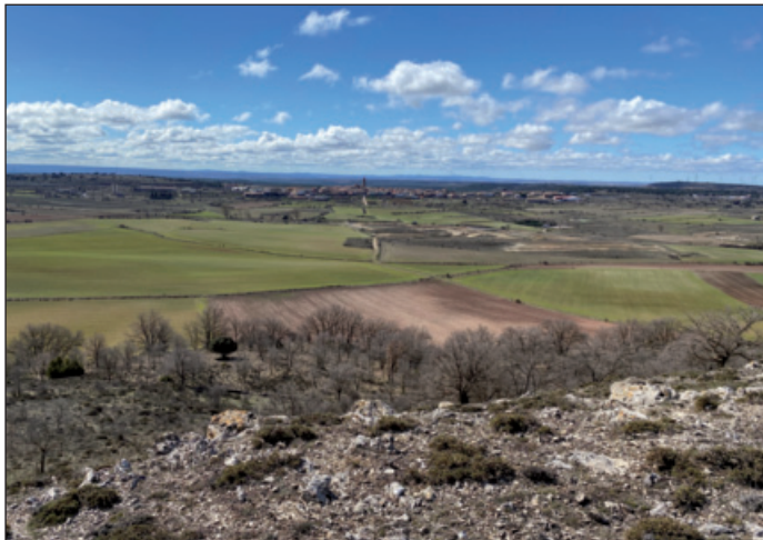
Vistas desde el mirador

A los 400 metros llegamos a la alambrada del aparcamiento invernal para vehículos pesados, que le vamos a bordear. Rodeamos todo el aparcamiento y una nava labrada y salimos a un carril que da acceso a esta nava. Seguimos por el carril que nos sacará a otro y le seguiremos a la izquierda para llegar ya a Alcolea del Pinar y dar por finalizada esta ruta