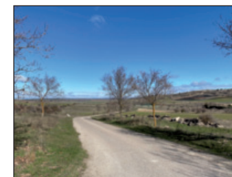
Camino de la fuente de los Tejados

Iniciamos un sencilla y corta ruta por la que vamos a recorrer de manera circular el entorno de Alcolea del Pinar.