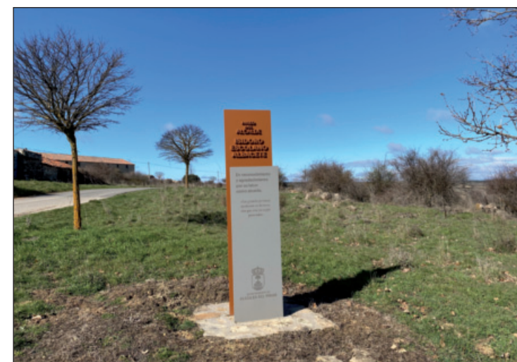
Monumento dedicado a Isidro Escolano

Dejamos todo camino que nos salga a derecha e