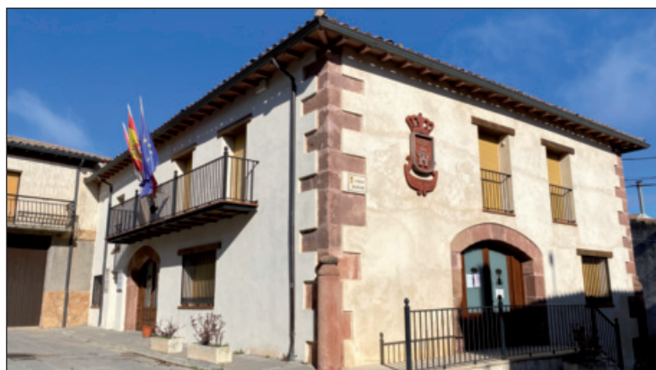
Edificio del ayuntamiento de Alcolea del Pinar

• INTERNET: http://www.aytoalcoleadelpinar.org/