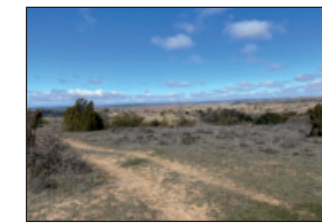
Paisaje de la ruta

El camino, asciende por monte bajo y a la