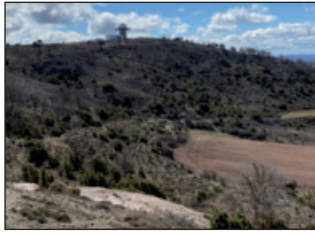
Radar de AENA

mos una flecha direccional que nos encamina a una vista panorámica. Se ha instalado una mesa de interpretación con las vistas que vemos sobre este paraje.