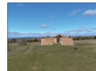
Vieja paridera hundida

Pasamos junto a una gran cerca de piedra y poco después encontra-